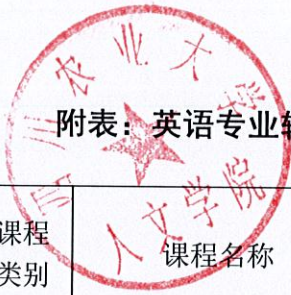
附表：英语专业辅修学士学位人才培养方案（总学分要求：75 学分）